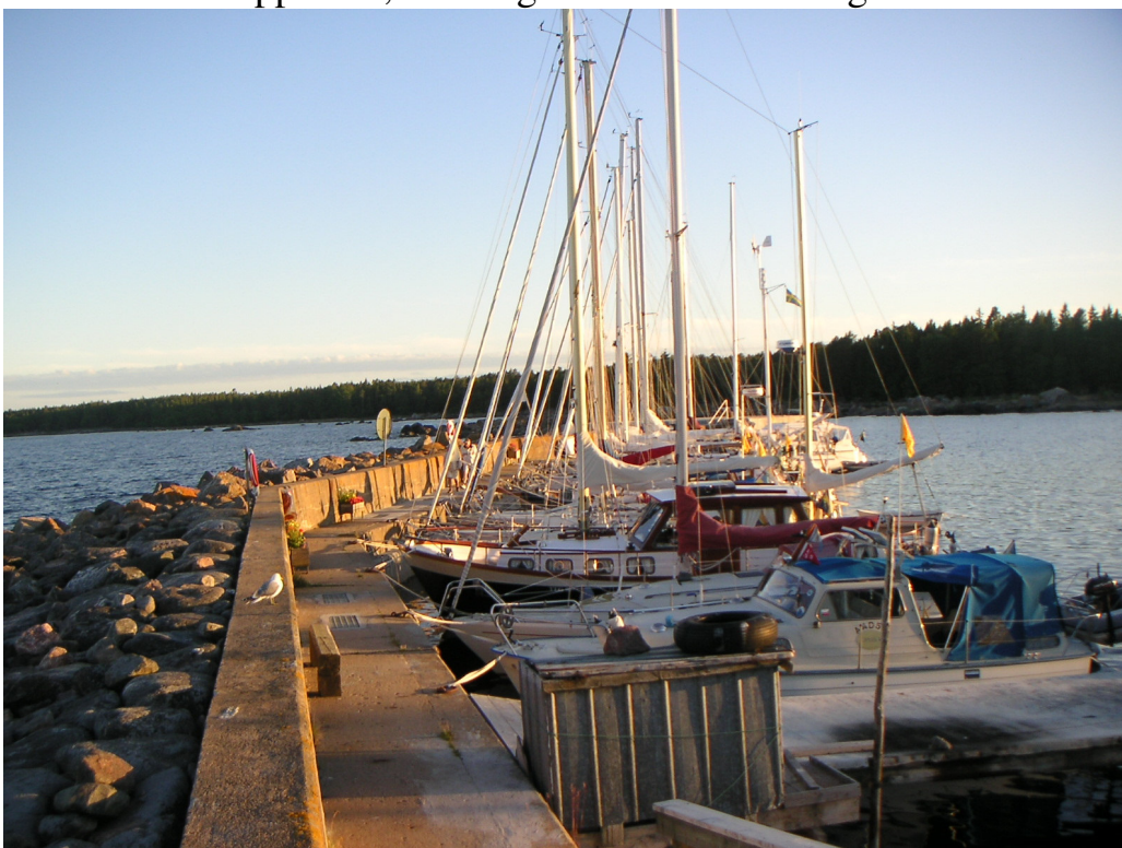
Storjungfrun, en av många charmiga hamnar

Höga kusten är ju speciell, med för svenska förhållanden storslagen natur. Påminner lite om Grekland, fastän bergen bara är några hundra meter höga, inte tusen. Vi såg många sälar, några tobisgrisslor och, på vägen hem, en hel flock havsörnar som anföll en skarvkoloni. Grynnor förekommer knappast. Höga kusten har, till skillnad från stora delar av övriga norrlandskusten, en hel del öar, men inte någon sådan skärgård som utanför Stockholm. Havet ligger ofta på och särskilt seglatsen mellan vår nordligaste hamn Trysunda utanför Örnsköldsvik och den kända Bönhamn blev väldigt skumpig med upp till tre meter höga vågor (enligt sakkunniga bedömningar). Ändå blåste det inte mer än 8-9 sekundmeter, så man förstod inte riktigt hur vågorna kunde bli så höga. Men fort gick det när vi surfade, över 8 knop i nedförsbackarna, vilket nog är fartrekord för vår Albin Cumulus. Det här var väl det mest dramatiska vi upplevde, men inget som kändes farligt.