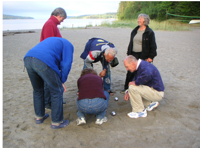
Vem kom närmast? Boultävling på stranden.

Höga kusten är ju speciell, med för svenska förhållanden storslagen natur. Påminner lite om Grekland, fastän bergen bara är några hundra meter höga, inte tusen. Vi såg många sälar, några tobisgrisslor och, på vägen hem, en hel flock havsörnar som anföll en skarvkoloni. Grynnor förekommer knappast. Höga kusten har, till skillnad från stora delar av övriga norrlandskusten, en hel del öar, men inte någon sådan skärgård som utanför Stockholm. Havet ligger ofta på och särskilt seglatsen mellan vår nordligaste hamn Trysunda utanför Örnsköldsvik och den kända Bönhamn blev väldigt skumpig med upp till tre meter höga vågor (enligt sakkunniga bedömningar). Ändå blåste det inte mer än 8-9 sekundmeter, så man förstod inte riktigt hur vågorna kunde bli så höga. Men fort gick det när vi surfade, över 8 knop i nedförsbackarna, vilket nog är fartrekord för vår Albin Cumulus. Det här var väl det mest dramatiska vi upplevde, men inget som kändes farligt.