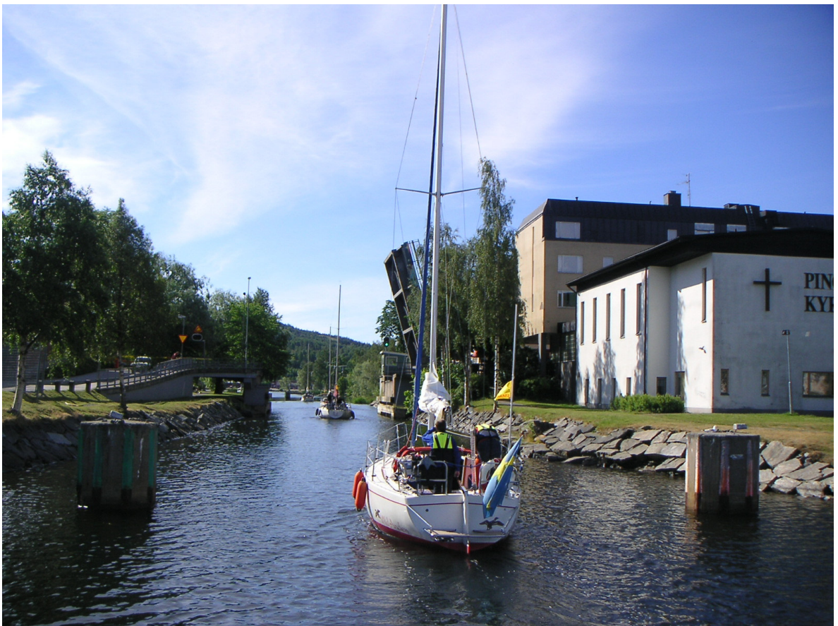
Eskadern på väg söderut genom Härnösands broar.